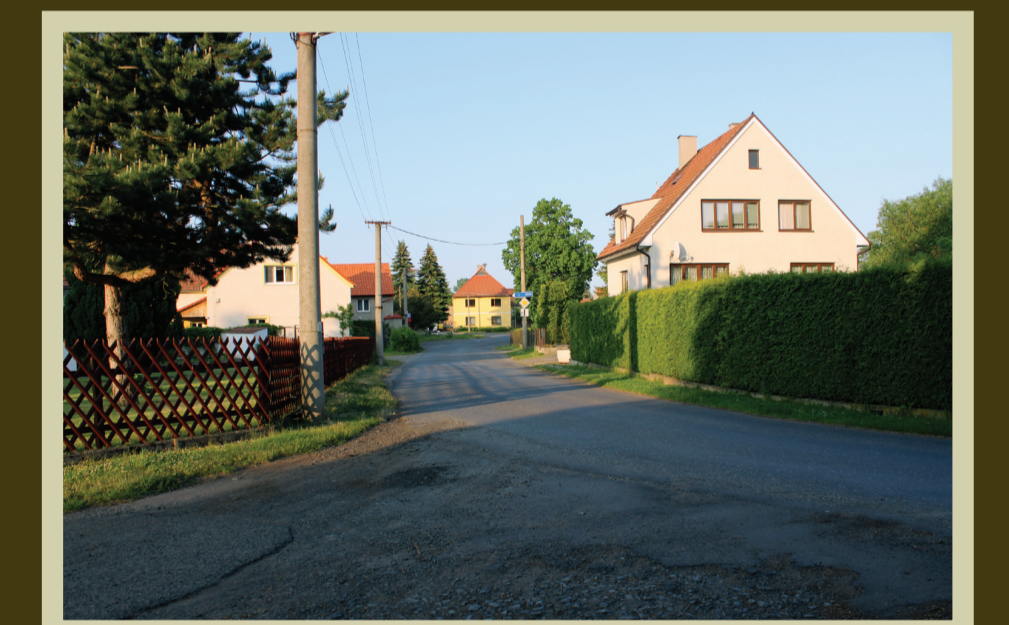
zatáčka u hostince Na Hrázi dnes