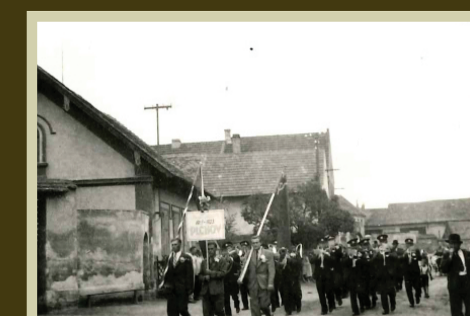
vlevo dům s č.p. 1