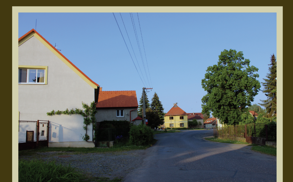
vlevo dům s č.p. 1

Informační tabule č. 9 byla pořízena z finančních prostředků Obce Plchov.