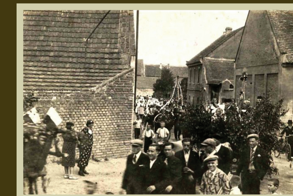
zatáčka u hostince Na Hrázi