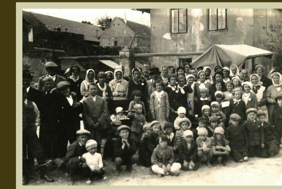
dům rodiny Mrázků