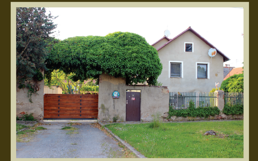
dům, který patřil rodině Mrázků